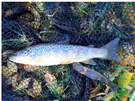
Zdeněk Pospíšil, G1

Loví se na umělou mušku a na UL přívlač. Pro někoho, bohužel, je pstruh vynikající pochoutkou.