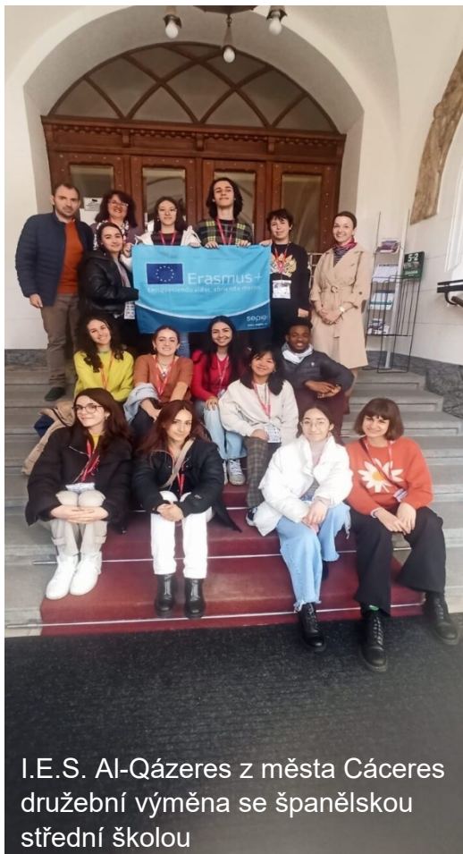
I.E.S. Al-Qázeres z města Cáceres družební výměna se španělskou střední školou

Jako dědictví předchozích kovidových let i dílem kvůli opětovnému rozběhnutí družebních výměn a také díky uskutečnění cest žáků v rámci Erasmu+ proběhlo ve školním roce rekordní množství akcí, při nichž žáci cestovali po republice nebo jeli do zahraničí. Na této stránce jsou upomínky na některé akce.