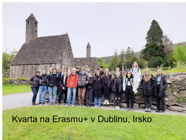
Kvarta na Erasmu+ v Dublinu, Irsko