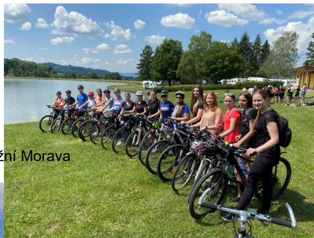
Cykloturistický kurz v červnu 2023 – Jižní Morava