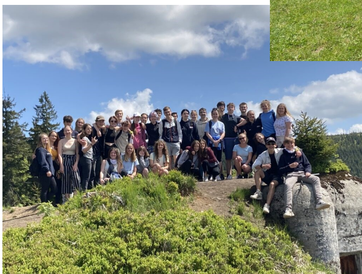
Družební výměna se školou Niftarlake College z holand- ského Maarsseu – naši byli v Nizozemí v dubnu, jejich partneři přijeli k nám v červnu.